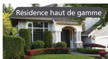
Résidence haut de gamme