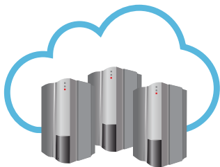
Serveur RISCO Cloud

La ProSYS™ Plus a été conçue en prenant en compte le fait qu'une communication fiable est cruciale pour les installations professionnelles. Elle ne vous fournit pas uniquement les dernières technologies de communications disponibles comme l'IP multi-socket, le 3G et le WiFi, mais elle supporte aussi la configuration multicanaux pour assurer la redondance complète de la communication.