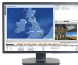
Système de Gestion